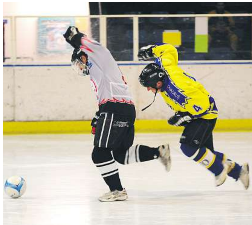
Nicht nur hier um Platz 5 – Mighty Ravens (grau) gegen Team Eisblick (gelb) – kamen die Akteure mit den Sportschuhen auf dem Eis kräftig ins Straucheln.