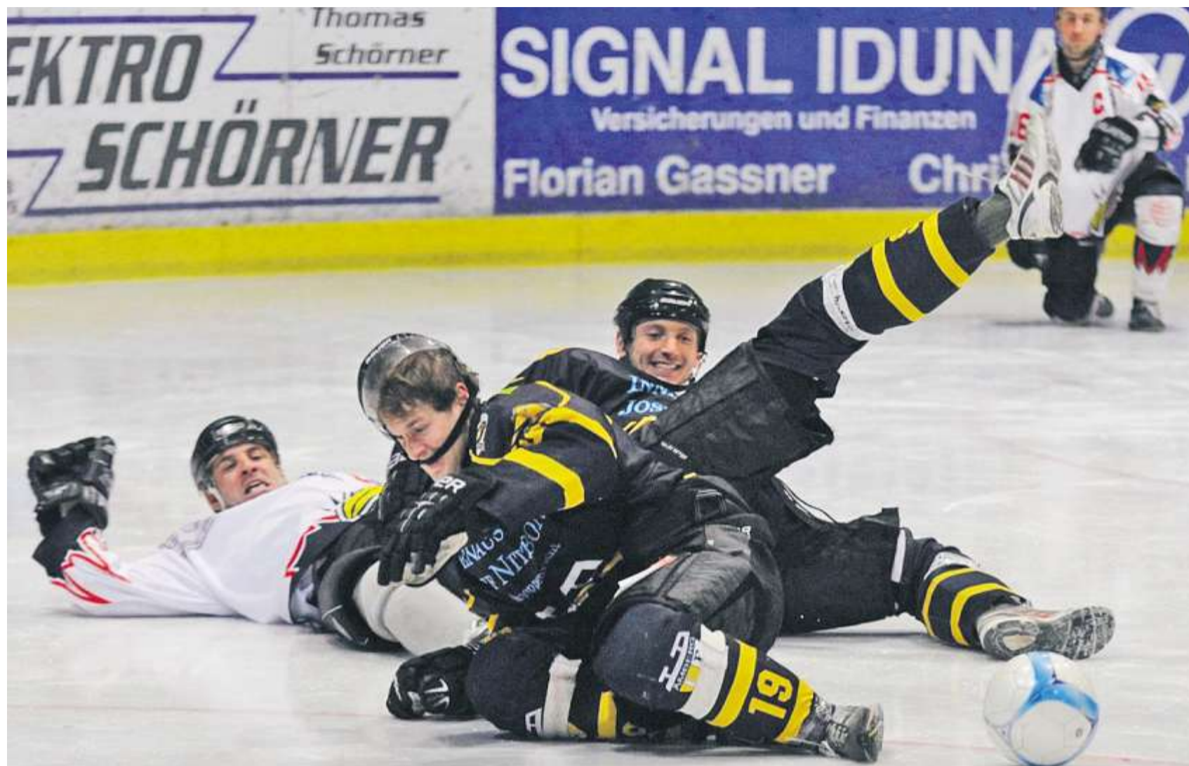
Bis zum Letzten gekämpft wurde erwartungsgemäß im Spiel des EC 2000 Amberg gegen den ERSC Amberg.